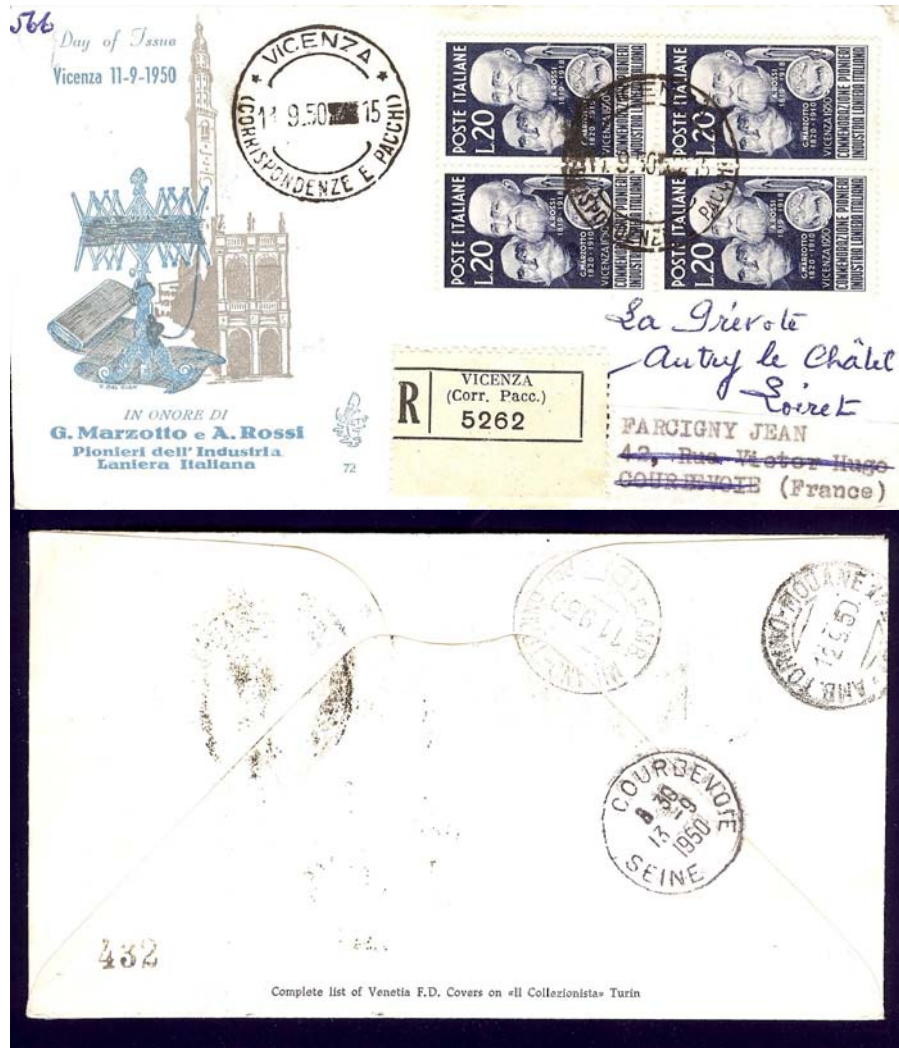
Affrancatura in quartina (rara) e viaggiata raccomandata in Francia