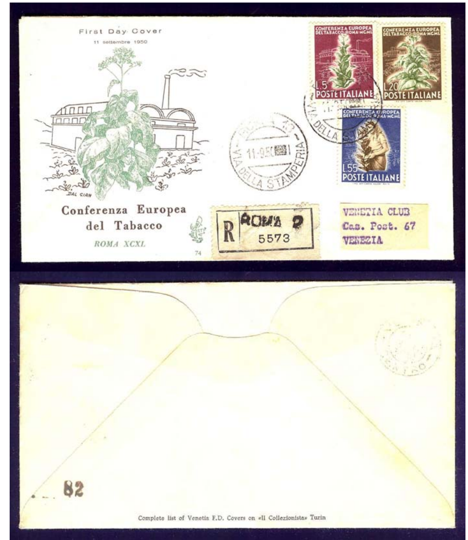
Viaggiata raccomandata a Venezia