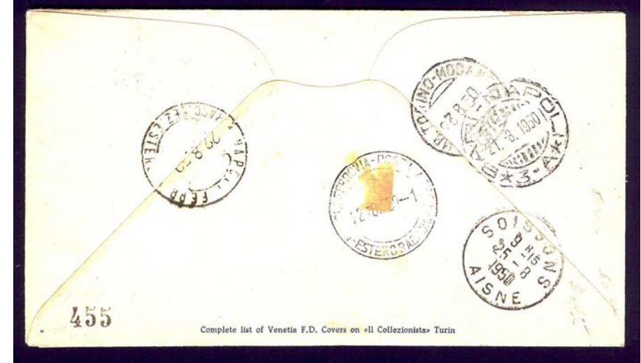
Affrancatura in quartina (rara) e viaggiata raccomandata a NYC (USA)