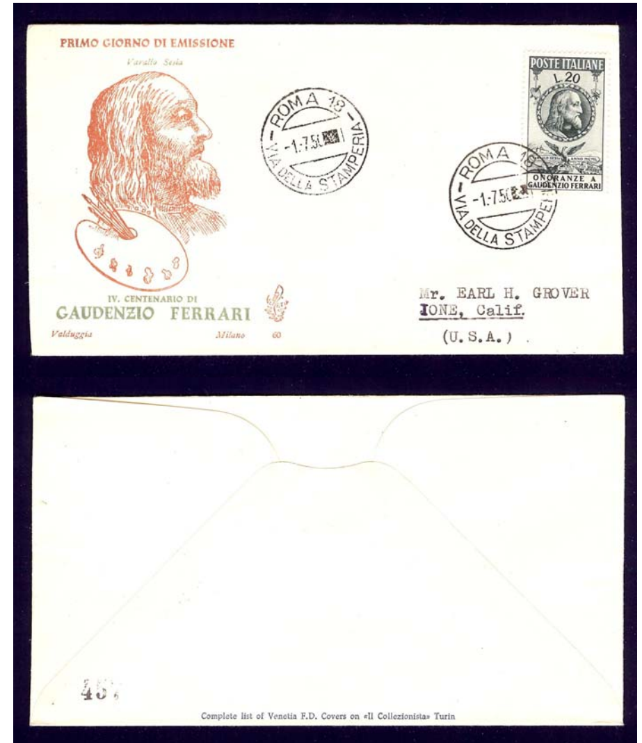
Indirizzata a Ione (USA), senza annullo di arrivo