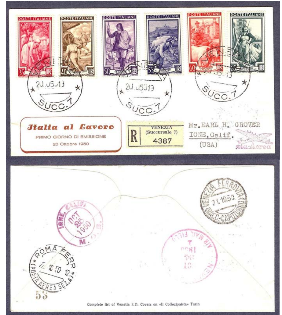
Viaggiata raccomandata a Ione (USA)