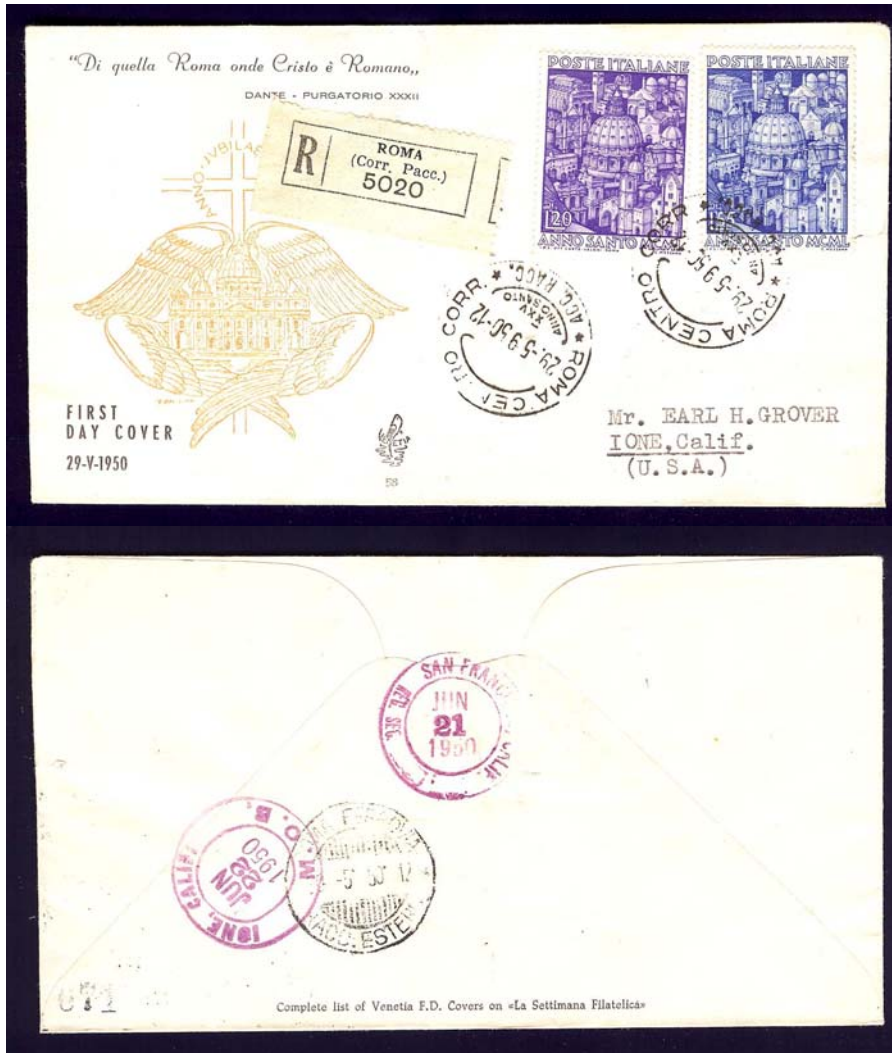
Viaggiata raccomandata a Ione (USA)