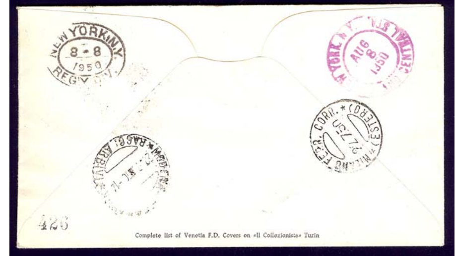
Viaggiata raccomandata a Long Island (USA)